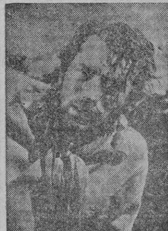
Gregory Peck, en una escena

(Lírico, Balear y Progreso) Después del podigioso "Sierra Madre", este film de William A. Wellman, se queda de muy corto alcance.