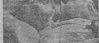
Una escena de la película

Aparte edades, la película es una más del gracioso actor argentino. En ella se nos muestra el hombre pueblerino, cuajado de complejos timidez e inferioridad.