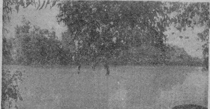
Una vista del río Jordán.

constituyeron e primitivo emirato de Transjordania, al cual más tarde a causa de la derrota de Chej Husein que después de haberse refugiado a Acaba se retiró a Chypre, fué anexionado el territorio de Acaba-Maan, con el cual fué definitivamente constituido el Emirato de Transjordania, más tarde transformado en Reino con el Emir Abdallah, hijo de Chej Husein, como soberano. Una vez constituido definitivamente, desde el punto de vista territorial, el Estado de Transjordania con sus fronteras, su capital y su soberano, Inglaterra reconoció oficialmente su independencia (1923) por un Tratado de alianza que por otra parte liquidaba la cuestión del Mandato británico sobre la parte de Palestina situada al Este del río Jordán.