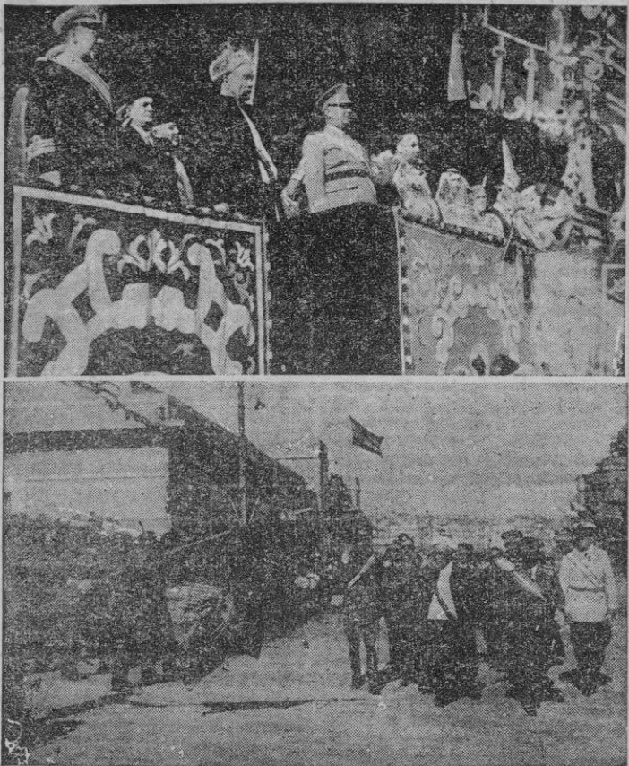
La Coruña. — El Rey Abdallah de Jordania, acompañado del Jefe del Estado español, ministros y personalidades, presencia el desfile militar desde el balcón principal del Ayuntamiento. — El Rey de Jordania y el Jefe del Estado español, pasan revista a las fuerzas militares que rindieron honores