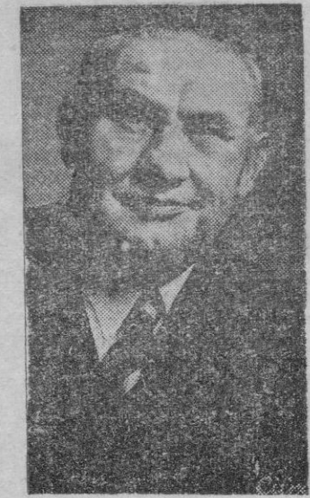
BEVIN representa al socialismo burgués.

Decididamente, si se miran las cosas por el lado de las conveniencias burguesas de los conservadores británicos, como si se observan a través del socialismo burgués de los laboristas, lo práctico es empezar a predicar con el ejemplo. Queremos decir que si se predica que todo el mundo coja una barrita de pan de auténtico trigo y la unte mantequilla o mermelada, la predica debe ser una realidad. Como hacen Bevin y Churchill cuando, al desayunar o al merendar, no discuten con la criada o con la mujer para mantequillarse o endulzarse el ánimo, cómodamente sentado en una butaca. ¡Oh, este sí que es un fantasmagórico ideal de la democracia y del liberalismo!