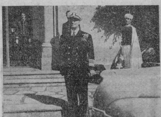
La Coruña. — El jefe de la Escuadra norteamericana, almirante Connolly, a su llegada al Pazo de Meirás, donde cumplimentó a S. E. el Jefe del Estado

Madrid 8. — El Almirante Conolly ha llegado a Barajas a bordo de un avión D. C. 4 con la bandera de Almirante en el aparato, que es pequeña, azul y con cuatro estrellas blancas. En el momento de desembarcar del avión, el Alcalde de Madrid, Conde de Santa Marta de Babilio, saludó al Almirante y a sus acompañantes en nombre del vecindario, y Conolly rogó al Alcalde transmitiera sus saludos al pueblo madrileño. El Almirante norteamericano salió a continuación en automóvil del aeródromo y visitó diversos lugares de la capital; entre ellos El Retiro, la Plaza Mayor y la Ciudad Universitaria. —(Cifra).