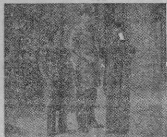
Una escena de "El Inspector Vargas"

En su género, entretenido como película un tanto teatral, no aporta nada a la perfección a que, últimamente, llegaron los de intriga.