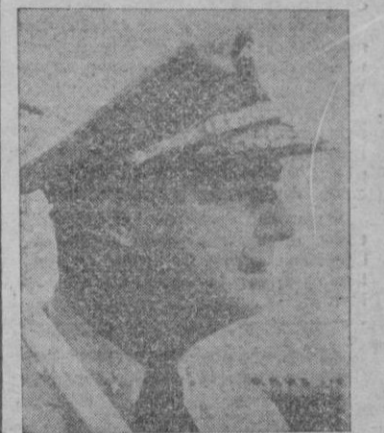
El Almirante Richard Lansing Connolly, jefe supremo de las fuerzas navales norteamericanas del Atlántico y el Mediterráneo, que al mando de una escuadra de cuatro buques de guerra, visitará la base española de El Ferrol del Caudillo próximamente