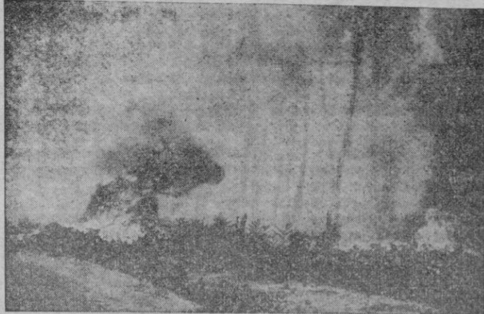
Burdeos. — Millares de hectáreas continúan siendo pasto de las llamas en la región de Las Landas. En la foto, aspecto que ofrece Mont de Marsan; los trabajos de salvamento están dirigidos personalmente por el ministro de Defensa, Ramadier.