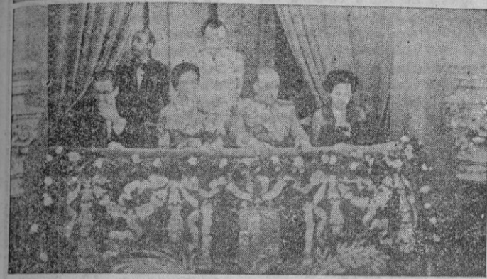
Arriba: S. E. el Jefe del Estado dirigiéndose a las Peñas de Haya, donde presenció un interesante ejercicio táctico. — Abajo: S. E. el Jefe del Estado, acompañado de su esposa en el palco presidencial, durante el baile que se celebró con motivo de la cena de gala que le fué ofrecida por el Ayuntamiento de esta ciudad.