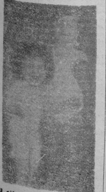
El niño y la niña más hermosos de París. La niña no parece estar conforme con el fallo del Jurado.