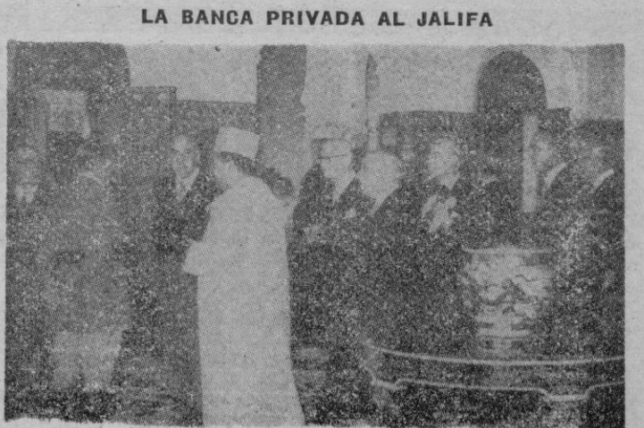
Tetuán. — El Jefe acompañado del Alto Comisario, teniente general Varela, conversando con los directores de la Banca privada española, que hicieron a S. A. I. un valioso regalo con motivo de su reciente enlace matrimonial.