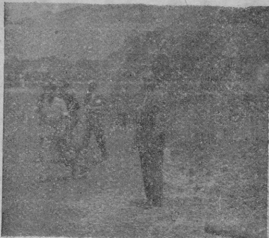
He aquí una de las primeras fotografías tomadas en el momento que la corriente de lava del volcán de La Palma, empieza a cortar la carretera del sur de la isla

Santa Cruz de Tenerife 14. — El nuevo cráter del volcán de Cumbres Viejas no arroja lava, pero sí grandes cantidades de humo y piedras incandescentes. Los brazos de lava del otro cráter aumentan su caudal. Se han registrado nuevos y violentos movimientos sísmicos que se han notado en toda la isla, incluso en la capital, Santa Cruz de la Palma. — (Cifra).