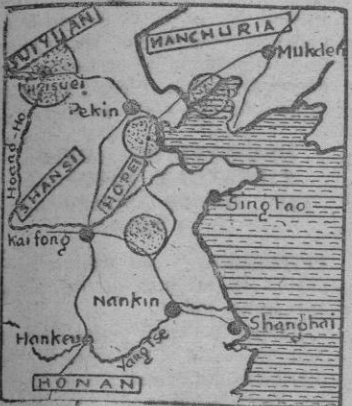
China y Filipinas se unen frente al comunismo en Asia.

Toda alianza, para ser efectiva, debe asentarse sobre cimientos sólidos que den al conglomerado cierta consistencia. En este caso, se me antoja harto arriesgada la aventura, especialmente para el recién nacido Estado filipino, con el que nos unen tan íntimos lazos de hermandad. No bastan buena voluntad y firme deseo de oponer barreras a la expansión del enemigo ideológico, porque si tras ese valladar no existe una fuerza coercitiva y organizada, capaz de mantenerlo, da pie para que el adversario arremeta contra él. Este es el caso evidente de los nuevos aliados. Sumados los Ejércitos de las cinco naciones antes citadas, apenas lograrían reunir el efectivo que tienen sobre las armas de los países balcánicos. Sabido es que el Japón fue desmilitarizado tras la capitulación de 1945. Australia posee una flota de guerra suficiente para proteger su extenso litoral, pero incapaz de tomar la ofensiva y menos enviar cuerpos expedicionarios hacia el