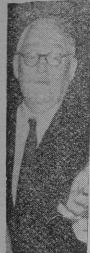
VICHYNSKY es más astuto que su antecesor