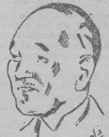
Chan-Kai-Chek debe escribir amargamente en el ostracismo...