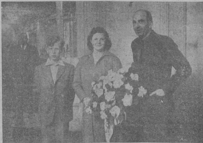
Barcelona. — El ex Rey Humberto de Saboya acompañado de sus hijos a su paso por esta capital.