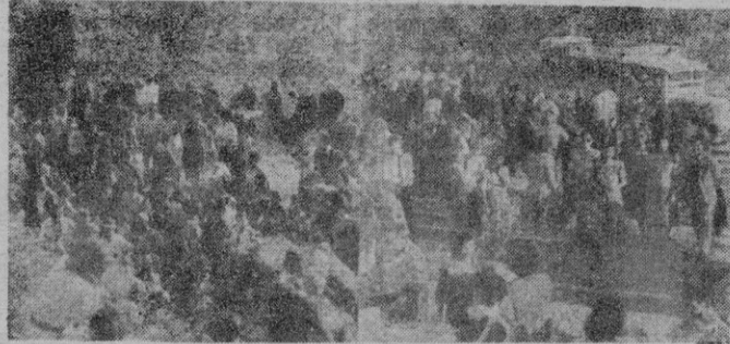
La concurrencia esperando para entrar en las Cuevas

La popular romería de San Miguel de Campanet, que viene celebrándose desde hace ya algunos siglos, la tercera fiesta de Pascua, ha revestido en este año un matiz muy diferente de todos los años anteriores.