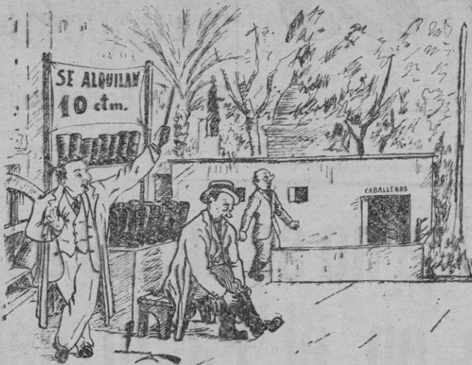
En los jardines de la Plaza de Santa Catalina Thomás. Un bello negocio que no se le ha ocurrido a nadie todavía.