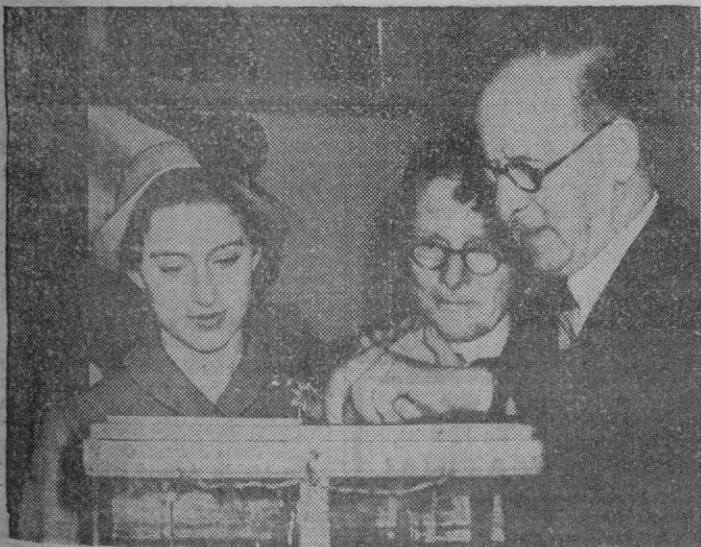
La Princesa Margarita, en su visita a una exposición celebrada en Sheffield, observa el funcionamiento de un baño para el dorado de cubiertos.

LA PRINCESA MARGARITA VISITA UNA EXPOSICION