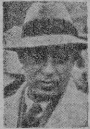
PANDIT NEHRU Sucesor de Gandhi y obstáculo n.º 1 del comunismo

Ahora, al inaugurar la Gran Bretaña su programa de apaciguamiento, la figura de Pandit Nehru, aunque borrada de la actualidad mundial permanece, con fuerza poderosa, en el alma de la India, llena de inquietudes y de misterio.