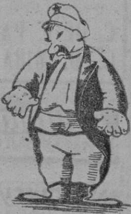
STALIN ya no toma el pelo más que a los tontos de remate

Resulta interesante centrar estas declaraciones de Stalin en el ambiente político internacional del momento en el cual se han producido estos dos hechos: Primero, una agria nota de Moscú a Londres y París, a propósito de las negociaciones en curso para la paz, y en marcha en el orden político y militar del Pacto Occidental; y después, la visita del embajador soviético al Ministerio de Negocios Extranjeros de Oslo para pedir explicaciones sobre la postura noruega ante el propuesto Pacto del Atlántico Norte; (teniendo especialmente en cuenta la circunstancia de que Noruega tiene frontera común con la Unión Soviética). Ambos hechos, desdeñada nota y amenazadora visita, contrastan fuertemente con esas concluyentes manifestaciones de Stalin, el cual, ante las preguntas de un periodista, ya tranquilo, ha empezado por decir que está presto a examinar la publicación de una declaración norteamericana afirmativa de que ninguno de los dos países recurrirá a la guerra mutua.