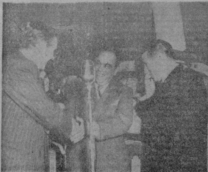
La Habana. — El Presidente depuesto de Venezuela, Romulo Gallegos, saluda al Presidente de la República de Cuba, señor Prío Socarras, durante la conmemoración de un acto patriótico en la capital cubana.