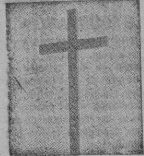
Ellos nuestros caídos, no fueron «carne de cañón»

Decíamos ayer que la estúpida baratija internacional del «caso español» va a entrar, de acuerdo con los deseos soviéticos, por caminos de una extraña novedad. Ya ni siquiera se nos llama «fascistas» en las peroraciones violentas de Radio Moscú sino que, lisa y llanamente, se nos considera como la «carne de cañón» que Norteamérica ha tenido a bien contratar para su futura acción guerrera contra la Unión Soviética. Estas espectaculares rabietas de la propaganda comunista no tienen más aparente justificación que la supuesta voluntad norteamericana de revisar sus relaciones con España a la luz de un baremo más realista y, sobre todo, más práctico y actual. Ni un gesto, ni una palabra española refrendan semejante presunción soviética; pero no es precisamente la veracidad un banderín que suela agitarse en las antenas de Radio Moscú. Por el momento, lo que conviene es presentar al Régimen español como incurso en un peligroso activismo contra la paz de Europa y, sobre todo, cortar todo acercamiento norteamericano-hacia el único pueblo del Continente que discurre por caminos de una ordenada y pacífica recuperación.