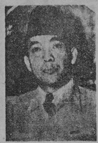
DR. AMED SOEKARNO El primer resistente contra Holanda

En verdad, no puede afirmarse que la ocupación de Java y Sumatra por Holanda haya ofrecido características sangrientas de conquista. Desde que, en 1596, arrojaron a los portugueses, cabe sólo registrar una insurrección armada allá por el año 1825. Cierzo que el indígena fué siempre indolente, poco batallador y más aficionado a masticar «bete» que a manejar el clásico «kriss» malayo para otra cosa que no sea cortar la caña de azúcar. Por otra parte, la raza neerlandesa tiene un concepto diametralmente al de nosotros, españoles, en materia colonizadora.