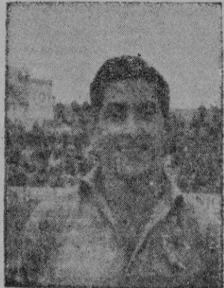
MIJARES uno de los pocos que se salvaron el pasado domingo.

El Escoriaza es esperado mañana en el buque correo de Barcelona, en donde se hallan sus jugadores desde el domingo que jugaron contra el Tarrasa, por cierto no con muy buena fortuna. ENEBE