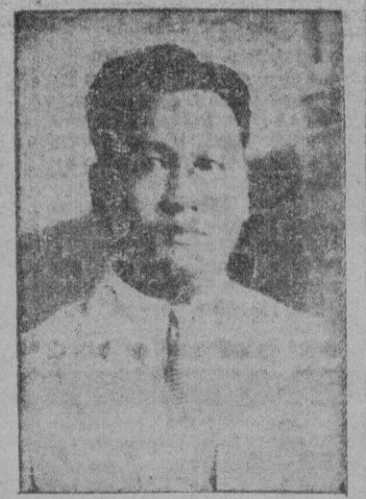
D. Nicanor Carag, nuevo Consul General de Filipinas en Madrid, que ha salido de Manila para tomar posesión de su cargo.