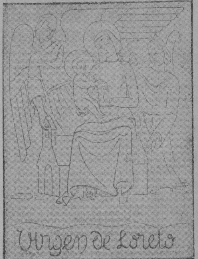
Los caballeros del Aire honran hoy a Nuestra Señora de Loreto, patrona de la Aviación española. Ella que supo conducir las alas de nuestra Patria a la victoria en la guerra y a la prosperidad en la paz, que tendió siempre su manto amoroso de protección a nuestros aviadores, recibe hoy el homenaje fervoroso de gratitud y amor que le rinden sus hijos

REDACCION: DANUS, 2 Redacción: 2078 Teléfonos: Administración: 1745