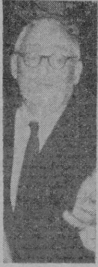
VICHINSKY ahora en la ONU usa pulidor de uñas

No canten victoria ciertas llamadas democracias porque Vichinsky usa pulidor de uñas en la ONU, las garras elementales y firmes; las emplea el comunismo en China y en Hispanoamérica. Es tener estúpida mentalidad de pelicularo el soñar que el soviétismo se domina con un frívolo sombrero mercado en París, como en «Ninotchka».