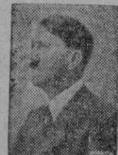
HITLER cometió tres graves errores psicológicos.

Es su manera de ser, su psicología. Stalin pierde la partida por desear al hombre, por considerarle hombre-económico y no hombre-alma.