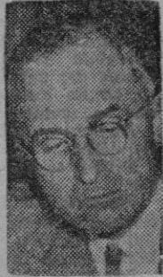
TRUMAN A no ser que venga él a verme