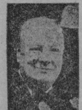
CHURCHILL exclamaba: «Necesitamos aguantar dos años.»