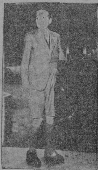
Se encuentra ya en Madrid para comenzar sus estudios de bachillerato el príncipe don Juan Carlos hijo de S.A.R. el Conde de Barcelona. He aquí una instantánea de su llegada.