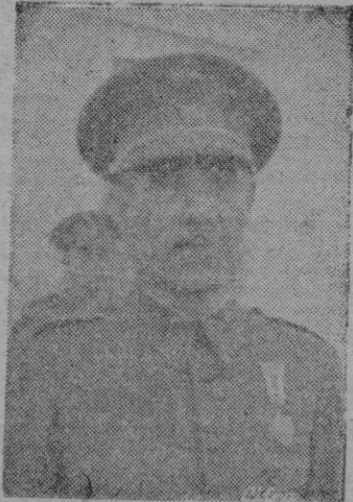
Excmo. Sr. D. Carlos Asensio Cabanillas.

Informe sobre relaciones culturales. Expedientes de personal. GOBERNACION.—Decreto-ley relativo a préstamos o anticipos del Instituto Nacional de la Vivienda a la Dirección General de la Guardia Civil, para sus edificaciones. Expedientes de revisión del presupuesto por aumento de precios de las obras en construcción de los cuarteles de la Guardia Civil de varios pueblos.