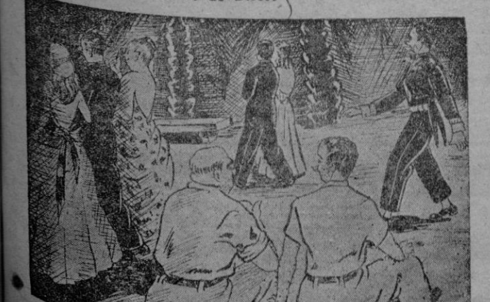
«Y ese también va de etiqueta. — Si, de etiqueta racionada.»