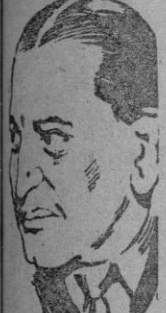
JDANOV. Su amigo personal de Stalin.

A la muerte de Jdanov se le concede singular importancia en grandes capitales europeas.