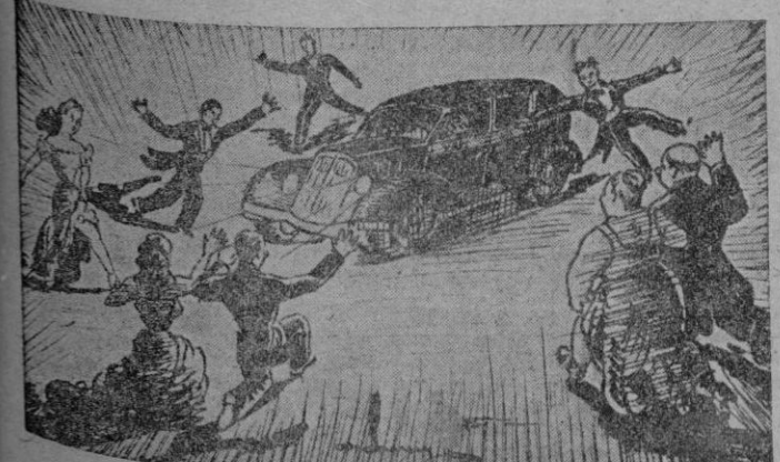
«¡Taxi, taxi, por amor de Dios!»