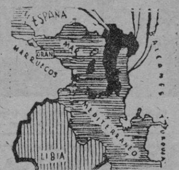
Italia tiene forma de bota, por algo será

los angloamericanos y para sus fuerzas armadas que operasen en los dos países latinos beligerantes al lado de Rusia.