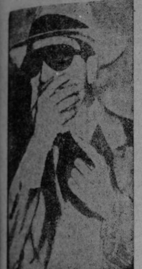
V. KRAVCHENKO «Escogió la libertad»

Abogando por una más estrecha cooperación entre las potencias occidentales el «Daily Mail» escribe: «Este mes ha hecho tres años desde que la bomba atómica puso fin a la segunda guerra mundial, y seguimos esforzándonos por entendernos con Rusia. Hace tres semanas que se han iniciado las conversaciones de Moscú sobre la crisis de Berlín y seguimos intentando poner fin a la desagradable situación con los rusos. Si estas conversaciones fracasan no habrá futuro asegurado para ninguno de nosotros. Si tienen éxito, debemos probar una vez más de conseguir una paz permanente. Para la Gran Bretaña, América y Francia no puede haber retirada en Berlín. Esto ha sido expuesto claramente en Moscú y por este motivo se vislumbran indicios del deseo por parte de Rusia de poner fin al punto muerto. Esta vez han debido comprender la necesidad de hacer alguna concesión. Podemos sólo abrigar esta esperanza. Hemos declarado muchas veces — y lo repetimos ahora — que creemos que Rusia no desea la guerra. Pero mientras vea a las potencias occidentales divididas y vacilantes intentará conseguir las máximas ventajas en beneficio propio.» el diario menciona a continuación ciertas vacilaciones en materia de defensa y en unión europea si se quiere llevar a la realidad a la unión occidental. Hasta que las potencias occidentales no concreten verdaderamente lo que dicen relativo a cooperación, coordinación, etc., tendrán disgustos con el tío José.» Más o menos, estamos de acuerdo.