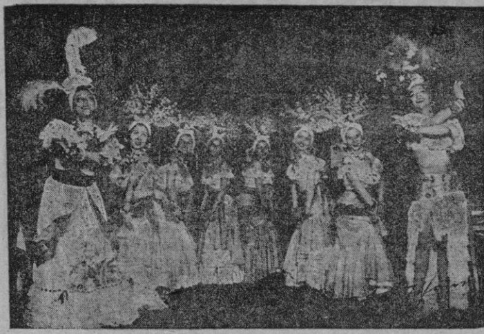
El afamado ballet «Marley-Girls», que anoche debutó en «Rosales» con gran éxito