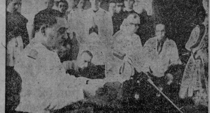
Panjón (Vigo).—El Ministro de Marina, (Almirante Regalado, leyendo la ofrenda al mar en el templo votivo de Panjón.