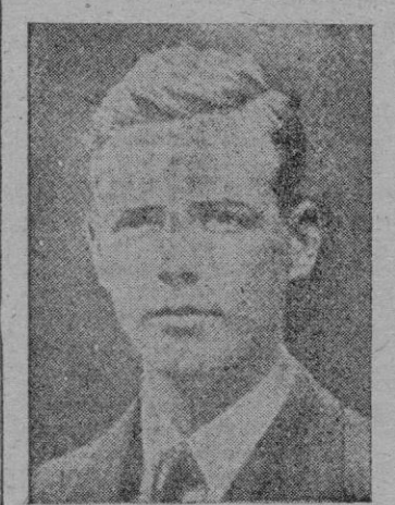
EL CORONEL LINDBERGH

ña de una pensión de Newark puso a la Policía en seguimiento de tres hombres y una mujer. El célebre Al Capone, que por entonces cumplía condena en Chi-