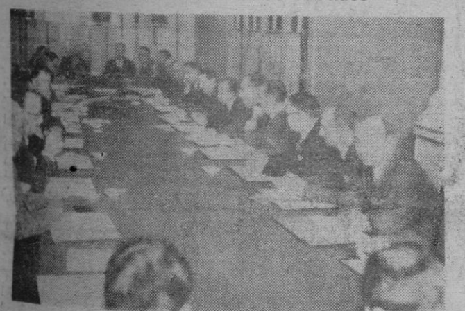
Madrid. — Los delegados españoles y franceses durante la primera reunión de los representantes de los ferrocarriles de España y Marruecos, celebrada en Madrid, para tratar del establecimiento del ferrocarril Maroc Express.

"Franco como pronosticador: 100 Sir Sam como pronosticador: bueno ya lo ven ustedes" Franco predijo lo que ocurriría en Europa