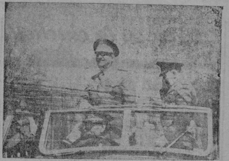
El Caudillo corresponde a las aclamaciones de la muchedumbre que se congregó en la Plaza de Oriente, después del desfile. — La artillería motorizada a su paso ante la tribuna del Generalísimo. — El Jefe del Estado a su llegada al paseo de la Castellana para presenciar el desfile.