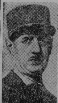
DE GAULLE más vital de estos servicios en caso de huelga. Hizo notar que no se trataba de Sindicatos ni de un movimiento clandestino. El primero de Mayo celebrarán una gran concentración en París.—Efe.

Washington 2.—Se espera que el Senado decida en las últimas horas de hoy sobre el programa de ayuda a Europa, aprobado hace unas horas por la Cámara de Representantes, y que el mismo será enviado al Presidente Truman antes de terminar la semana.—Efe.