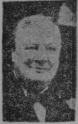
CHURCHILL Uno de los hombres que sabe más cosas de la guerra.