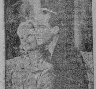
Anna Neagle y Michael Wilding en una escena.

«Incidente en Piccadilly» ASTORIA, PROTECTORA Y METROPOL Un film inglés sobre una anécdota dramática, con situaciones del más extremado sentimentalismo. En el Londres azotado por los bombardeos se celebra uno de esos matrimonios de guerra, que la guerra separa inmediatamente al lanzar a los esposos, cada uno al servicio de la nación, por caminos distintos.