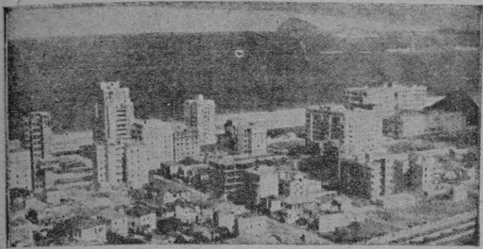
Una bella perspectiva de Rio de Janeiro.

El Presidente del Brasil inauguró la magna exposición