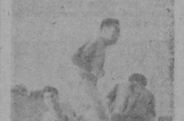
«Juanets» nos mandó esta fotografía, nosotros no sabemos que nos ponerle, a no ser la «danza del bugui», pues incluso se le escapó el balón o se olvidó de pintarlo.

de mérito. No tuvo rematadores en la delantera y quizás sea esta la causa de que se entregaran al principio del segundo tiempo.