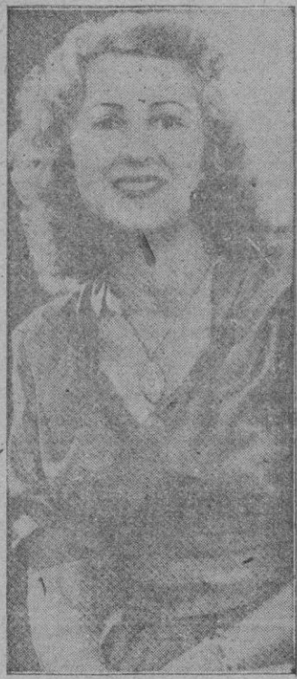
Eva Braun, el extraño amor de Adolfo Hitler.