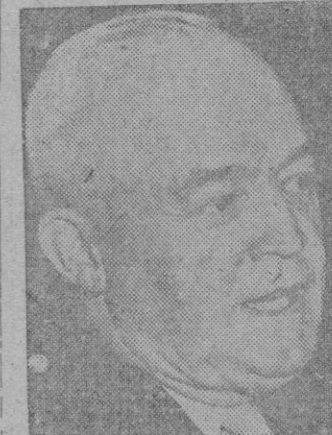
Los Generales Carl A. Spaatz y Henry H. Arnold, Jefes superiores de las Fuerzas Aéreas norteamericanas.

—a más largo o corto plazo— otra desembocadura que la guerra, todo son cálculos ya sobre la importancia de las fuerzas que unos y otros pueden presentar en el tremendo choque. ¿Ha de tachársenos de pesimistas por hablar así?