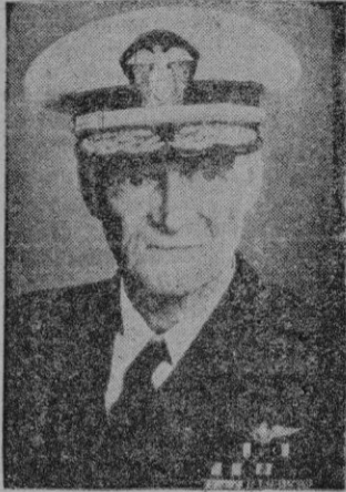
M. A. MITSCHER Jefe de la Escuadra norteamericana en el Mediterráneo.

Pero como la prosa oficial no suele pecar de sincera, los intérpretes de dicha disposición opinan que ésta constituye un suplemento a la advertencia hecha recientemente por el Secretario de Asuntos Exteriores, Mr. Lovett, a los vecinos septentrionales de Grecia para que se abstengan de reconocer al Gobierno del cabecilla rebelde griego general Markos, ya que se consideraría dicho acto como altamente perjudicial para la paz.