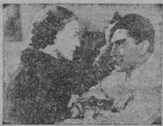
Una escena de la película

Sigue el cine mejicano afinando la puntería, pero sin dar en la diana. Busca temas interesantes los encuentra, pone a su servicio todos los elementos cinematográficos de que dispone y elabora la película con la mayor ilusión y el máximo esfuerzo. Sin embargo, la buena intención y el entusiasta esfuerzo no tienen como recompensa la obra lograda. ¿Por qué?