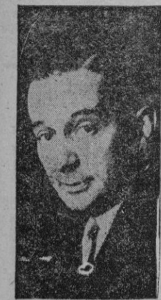
LÉONID BREZHNEV M. R. P. O. R. I. P.

La actividad de la O. N. U. sigue con la misma intensidad. En Londres se han reunido los Ministros de Asuntos Exteriores de los «dos grandes» y los dos más pequeños. En Francia, la huelga general parece inmediata. En Italia, los disturbios no cesan y la situación del Gobierno parece cada día más difícil. Mientras Marshall, Molotov, Bevin y Bidault tratan de prolongar la incertidumbre mundial como único medio de consagración, en la O. N. U. se aprueba la partición de Palestina con gran júbilo de los judíos y amenazante malhumor de los Estados árabes. El señor Schuman, siguiendo una orientación análoga a la del señor Ramadier, se ve impotente para solucionar el caos económico, social y alimenticio que se avecina de seguir la ola de huelgas inspiradas por el Partido Comunista francés. Si a esto añadimos que Italia bordea la guerra civil y que los dos colosos se aprestan a una inmediata lucha económica en Europa, tendremos un poco halagüeño panorama de la situación internacional.