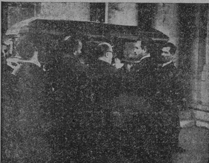
Valencia. — El Alcalde de la ciudad en el momento de recibir los restos del laureado escultor don Mariano Benlliure a la puerta del Ayuntamiento de Valencia.