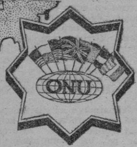
El «caso español» sólo cabe ya en su desván.

El Comité Político y de Seguridad de las Naciones Unidas ha decidido traspasar el ya voluminoso expediente relativo al «caso de España» al Consejo de Seguridad, el que a su vez lo endosó a la Asamblea General en noviembre del año pasado. Las discusiones promovidas en torno de esa ficción, han servido únicamente para poner de relieve que España no está ya sola, sino que cuenta con numerosas y agueridas amistades, entre las que figuran casi todas las repúblicas americanas de su estirpe, y otras naciones ilustres.