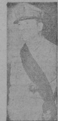
MAG ARTHUR tan buen político y gobernante como militar

Los Estados Unidos han decidido pedir a las demás naciones representadas en la Comisión Aliada de Extremo Oriente, que comiencen a trabajar en la redacción del tratado de paz con el Japón sin contar con Rusia. Los guerrilleros comunistas griegos han proclamado la República independiente. La Comisión de energía atómica de la UNO acuerda declarar inadecuadas las proposiciones soviéticas para el control atómico y aplazar indefinidamente la discusión, sin hacer caso de las protestas del delegado ruso Gromyko. Y Francia, convoca de urgencia un Consejo de ministros, para decidir abandonar la lucha en Indochina.