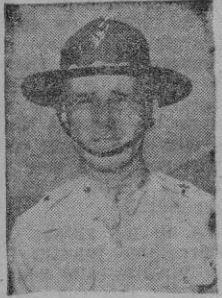
WEDEMEYER Un hombre entre Washington y Nankin

Al acabarse 1946 pareció que los norteamericanos se desentendían de los graves asuntos chinos. Era un poco duro creer que los Estados Unidos se hallasen dispuestos a inhibirse en la cuestión del Extremo Oriente. Al fin y al cabo, la integridad de China y «la política de puerta abierta» fueron el gran propósito yanqui en el Pacífico y uno de los principales postulados de la acción internacional de Washington. Dejar China ahora abandonada a su suerte, equivalía con toda probabilidad a permitir que acabase siendo presa de Rusia y a perder los Estados Unidos un mercado de 400 millones de habitantes. Al declarar Washington, por último, el día 29 de enero, que cesaba en sus intentos de establecer la paz en China, tuvo esto por señal de que los yanquis no querían complicarse en el avispero del Oriente asiático.