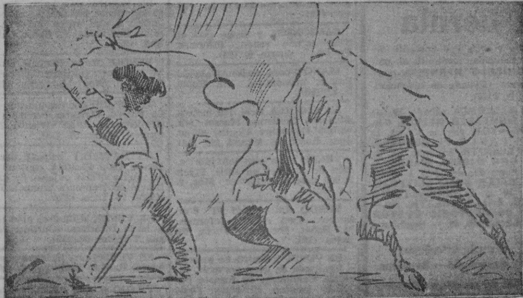
Dominguín ejecuta la larga cambiada en el sexto toro