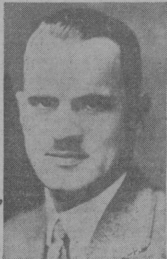
Arthur Compton, físico americano que ha intervenido en los trabajos para el descubrimiento de la bomba atómica, en Norteamérica