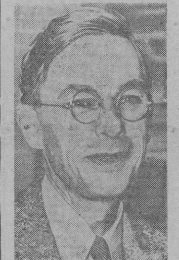
El presidente de la Universidad de Harvard, James B. Conna, uno de los investigadores que más han trabajado para el descubrimiento de la bomba atómica.

Rutherford Hall reúne todo el confort y los adelantos de los mejores hoteles americanos. Tienen también un estudio, una orquesta sinfónica, sus escuelas, cafés, teatros, almacenes, cines, Cámara de Comercio, sociedades culturales y un sinnúmero de instituciones de todos los géneros. A pesar de ello, Oak Ridge no es una ciudad cualquiera. Está regida por unos directores de fábricas que conocen a todos los vecinos por su propio nombre, y los habitantes están gobernados por empleados de una empresa neoyorquina que es la que abastece a las tiendas de comestibles, garages, institutos de belleza, peluquerías, zapatería, comercios, etc. Los consumidores pagan un tanto por ciento de sus ingresos a la empresa, la cual, a su vez, entrega la mayor parte de sus beneficios al Gobierno, destinando el resto a los gastos públicos.