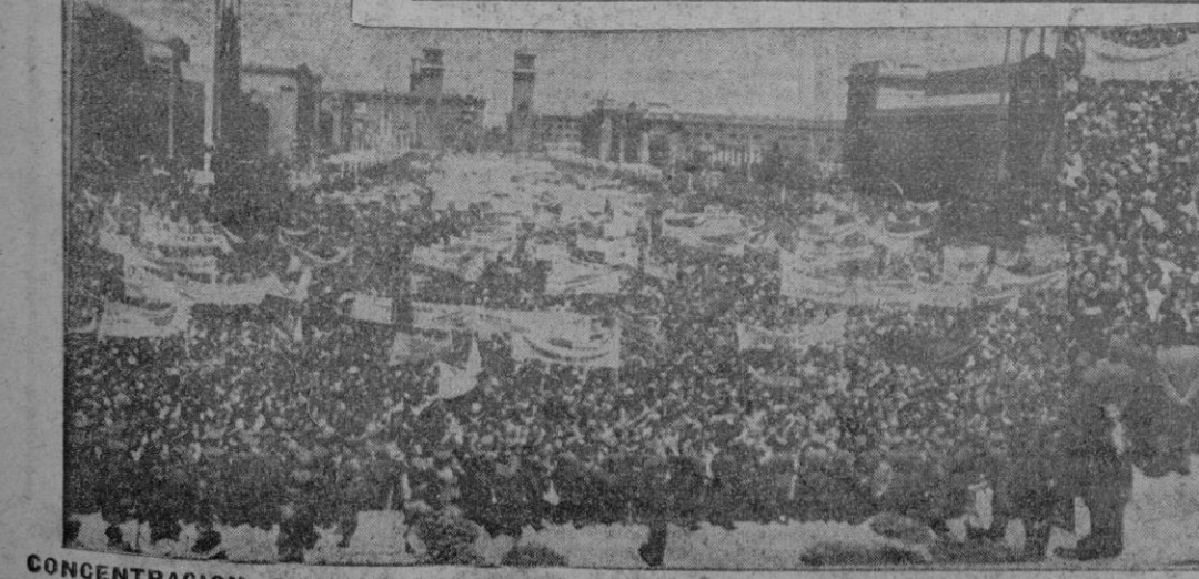
CONCENTRACION SINDICAL ANTE EL CAUDILLO EN BARCELONA. — Un aspecto de la muchedumbre que se calcula en medio millón de personas que asistió a la concentración sindical ante S. E. el Jefe del Estado.