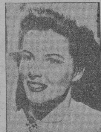
Katherine Hepburn, a la que veremos en breve en unos «Hermanos Karamazov» posiblemente distintos...