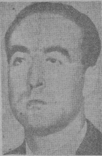
industria y Comercio. La presencia de Arelliza en Buenos Aires representa una nueva etapa en la actividad diplomática entre los dos países.

Estos documentos fueron descubiertos por agentes del Intelligence Service británico y norteamericano en los archivos navales alemanes de Tambah. Cada tres semanas, a partir de ahora, van publicándose otras revelaciones y otros detalles contenidos en esos papeles. — Efe.