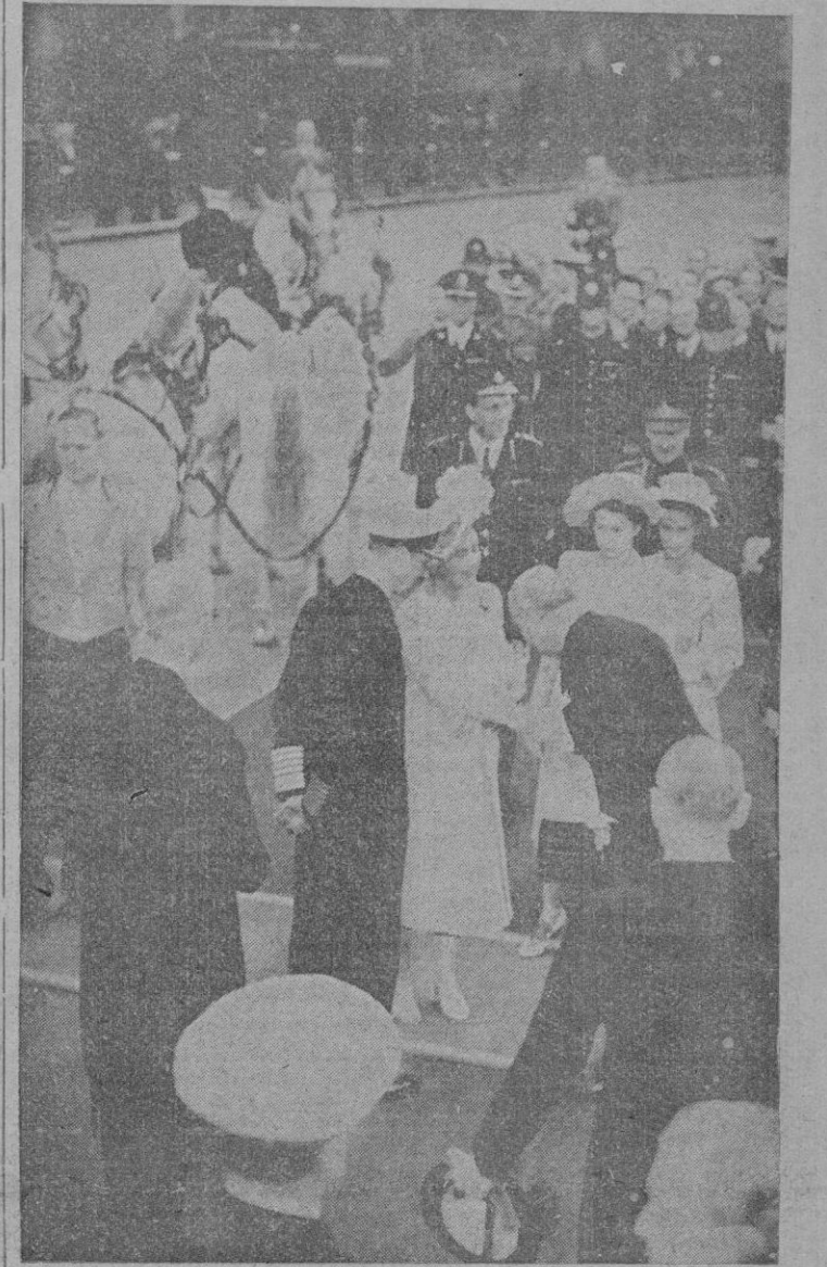
SS. REYES DE INGLATERRA, LA PRINCESA HEREDERA Y SU HERMANA LA PRINCESA MARGARITA, AL LLEGAR A LONDRES DESPUES DE SU LARGO VIAJE Y ESTANCIA EN AFRICA DEL SUR, SON SALUDADOS POR LAS AUTORIDADES Y PUEBLO QUE LOS ACLAMÓ