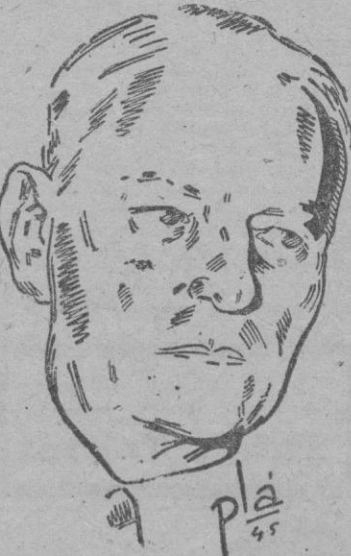
NIMITZ Zafarrancho de combate

Por último, las declaraciones de Nimitz sólo pueden referirse a un país determinado, Rusia, puesto que habla de acuerdos con el Canadá y con Filipinas, es decir hacia el Ártico y hacia el Pacífico. Lugares en que se entretorzan las esferas de influencia de rusos y norteamericanos. Decididamente, Estados Unidos están si fuera preciso, Rusia no puede hacerse la indiferente y ya se dice que Stalin quiere mostrarse conciliador.