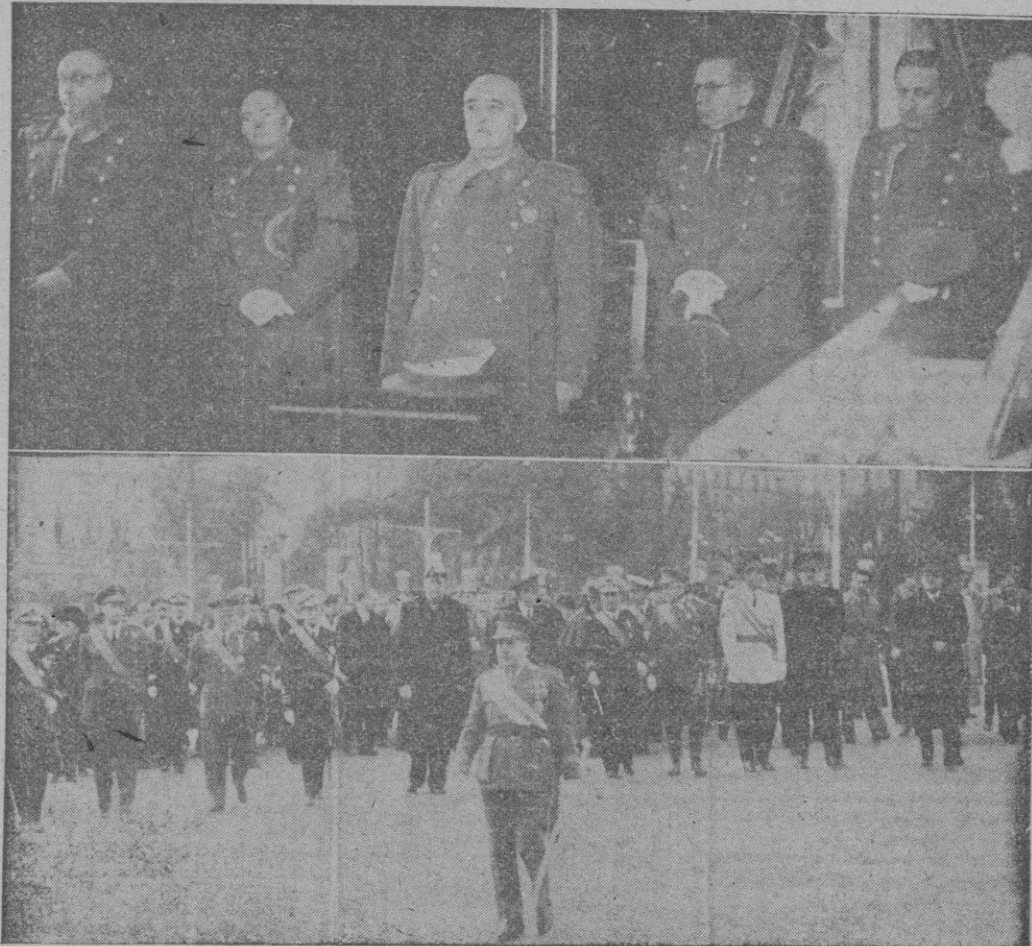
S. E. el Jefe del Estado ante los restos del glorioso General Primo de Rivera, durante la solemne ceremonia religiosa celebrada en la capilla ardiente instalada en el Ministerio del Ejército. — En la segunda instantánea vemos al Ministro del Ejército en representación del Caudillo, presidiendo, acompañado del Gobierno en pleno, el traslado de los restos del General Primo de Rivera desde la capilla ardiente a la Estación del Mediodía para ser conducidos a Jerez, donde han recibido ya sepultura definitiva.