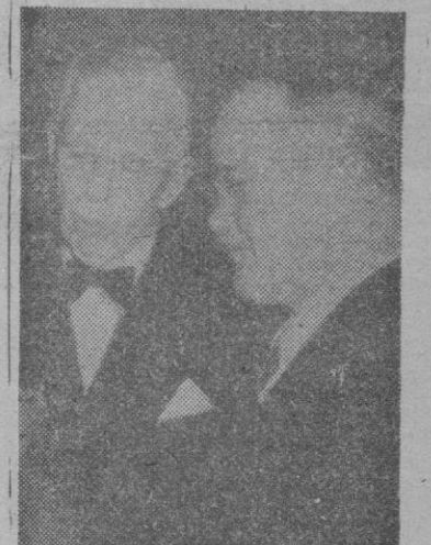
El Ministro de Relaciones Exteriores soviético Molotov ofrece una comida a los delegados de los cuatro países que asisten a la Conferencia que se celebra en la capital rusa. En la foto vemos a Molotov conversando con el secretario de Estado, norteamericano General Marshall.