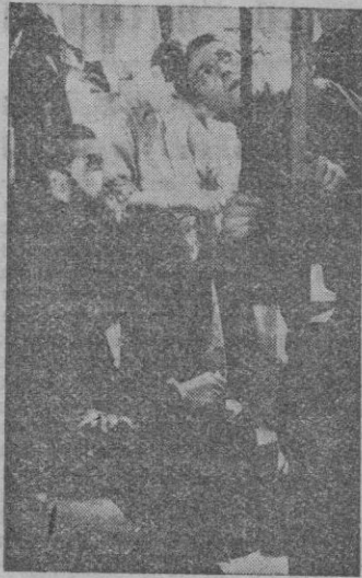
Una escena de «Hombres del mar».

Una película sueca que, ni por su técnica ni por otros valores, significa nada positivo.