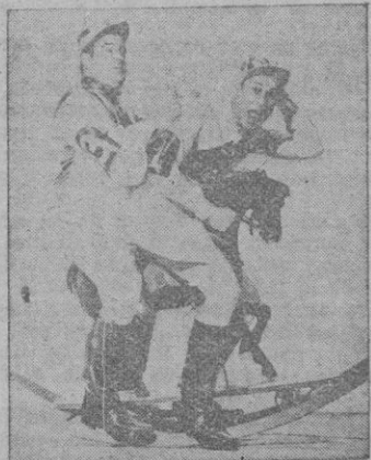
Bud Abbott y Lou Costello, la pareja del film.

Como base del programa los locales arriba mencionados ofrecen también en estreno una nueva patochada de Bud Abbott y Lou Costello, esos dos cómicos que tampoco tienen mucha gracia (es espantoso comprobar la falta de gracia de tantos y tantos «graciosos»)