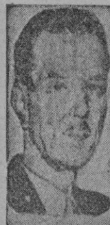
Régimen español no ha de ser en modo alguno causa de alejamiento entre su país y España.

Azzam Pacha puso igualmente de manifiesto que el actual régimen español no ha de ser en modo alguno causa de alejamiento entre su país y España.