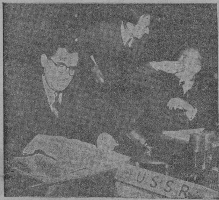
LAKE SUCCESS.— Durante una reunión del Consejo de Seguridad de las Naciones Unidas, el delegado británico Alexander Cadogan, habla con uno de sus ayudantes y por el gesto parece querer indicar: «Que no se entere Gromyko». — (Foto «Cifra»).

LONDRES 14.— LA RADIO DE MOSCÚ INFORMA QUE EN LA PASADA NOCHE CAYO UN AEROLITO EN VLADIVOSTOK, QUE ABRIÓ 55 CRATERES DE DIFERENTES DIMENSIONES. DE LA CAPITAL SOVIÉTICA HAN SALIDO PARA EL LUGAR DEL SUCESO UN GRUPO DE INVESTIGADORES. — Efe.