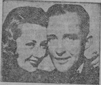
Joan Blondell y Bing Crosby en "Al este del cielo"

El asunto no es original y no descuellan tampoco su exposición en imágenes, bastante rutinaria aunque no mala. Un millonario cascastrabias no puede ver ni en pintura a su nuera, estando e cambio más que chiflado por el nietecito de corta edad. Unos personajes episódicos, los más graciosos, pasan por raptos del bebé y viven a su costa divertidas aventuras. Eso es todo.