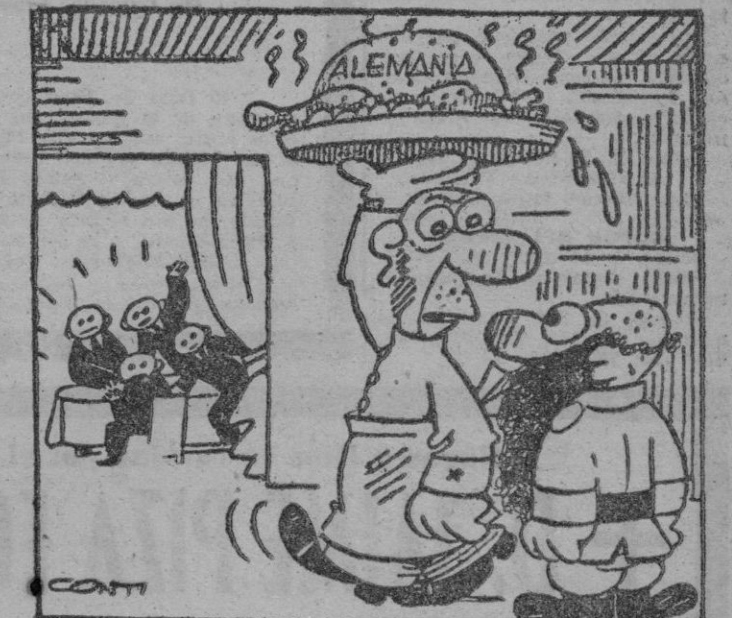
— Tienen tanto apetito esos «cuatro» que al repartir las raciones habrá jaleo.