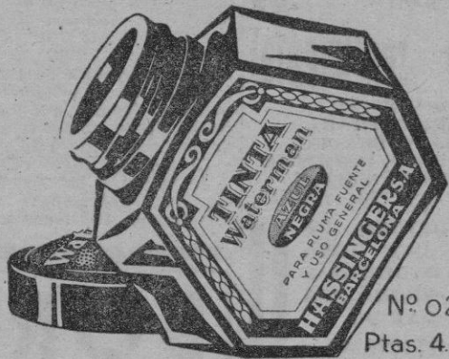
Nº 02 Ptas. 4.20