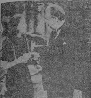
Charles Coburn y Sigfrid Curle, en una escena del film

Un nuevo ángulo de la lucha de los hombres sobre una tierra joven y en permanente descubrimiento: la de América del Norte y los hombres que, de todo el viejo mundo, luchan allí por la vida.