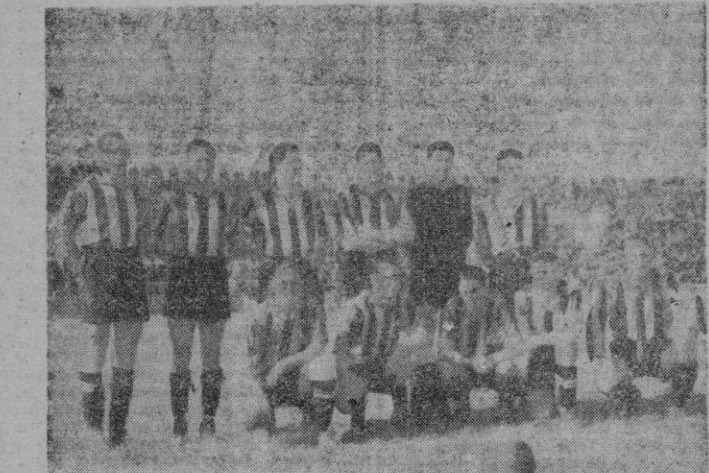
Equipo del Baracaldo, que perdió en Es Forti frente al Mallorca por 2-0

Martini & Rossi, S. A. Rambla Cataluña, 1 BARCELONA