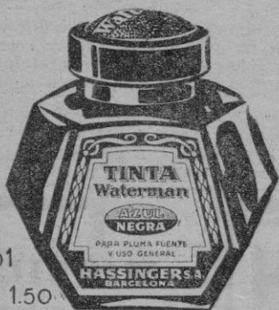
Nº 01 Ptas. 1.50