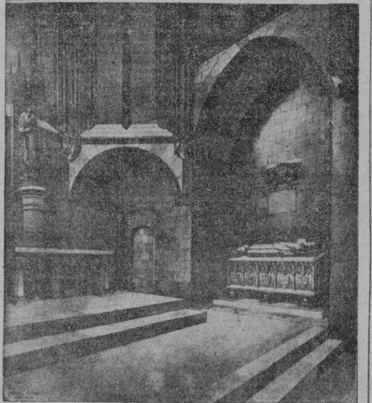
Capilla de la Santísima Trinidad, restaurada

Durante el siglo XV se construyó un entresijo, con el fin de aprovechar una dependencia su perior sobre una techumbre, en pinturas mudéjeres al temple, hoy en bastante mal estado. La reforma de la Capilla de la Santísima Trinidad pronto permitirá que sean instalados en ella los sacrófagos de los monarcas mallorquines, obra que se ha llevado a término por el Arquitecto D. Gabriel Alomar respetando los cánones del más puro arte arquitectónico. — F. G.