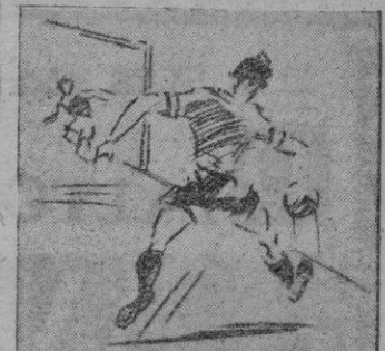
...pero igual mérito se debe conceder al centro servido por Oiva que como casi todos los suyos resultó perfectísimo