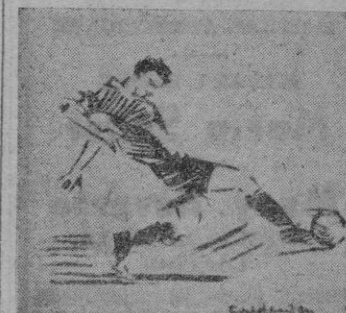
Magnífico fué el chut de Iturbe al conseguir el segundo tanto...