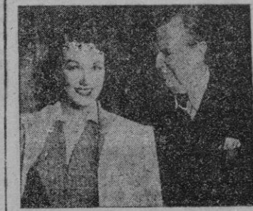
Ginny Simms y Charles Coburn, principales intérpretes de la película en una escena.

RIALTO y MODERNO Otra excelente comedia cinematográfica que, con creces, sustituye al teatro que no tenemos, y, algunos añoramos. No tiene, a la larga de su asunto, nada que se saiga de lo normal en el género, pero continúa y certemente todo es una pura sonrisa por razón de un diálogo lleno de buen sentido cómico y alegre. Y por si esto no fuera bastante tenemos ahí, animándolo todo con su poderosa personalidad, al actor Charles Coburn.