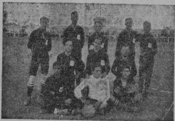
El equipo fundador de la R. S. Alfonso XIII (hoy C. D. Mallorca)

Ayer, se cumplió el XXXII aniversario de la Fundación de la Real Sociedad Alfonso XIII hoy C. D. Mallorca. No obstante los actos conmemorativos que acostumbra organizar el club todos los años en tal fecha, no tendrán lugar hasta el próximo domingo a fin de que siendo día festivo puedan sumarse a ellos todos los socios y simpatizantes que lo desean.