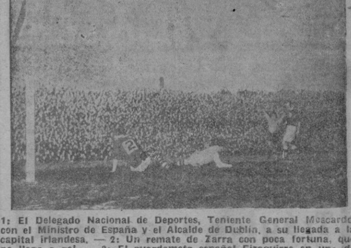
1: El Delegado Nacional de Deportes, Teniente General Moscardo, con el Ministro de España y el Alcalde de Dublin, a su llegada a la capital irlandesa. — 2: Un remate de Zorra con poca fortuna, que no llega a gol. — 3: El guardameta español Eizaguirre en una de sus afortunadas intervenciones, acosado por un delantero irlandés, mientras la defensa española permanece atenta a la jugada. — 4: Así fué el segundo tanto a favor de España. — (Foto «Cifra Gráfica»)