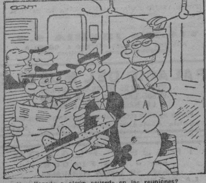
—¿Han llegado a algún acuerdo en las reuniones? —No sé, parece que Bevin... —¡No, no! Me refiero a las de matadores de toros.