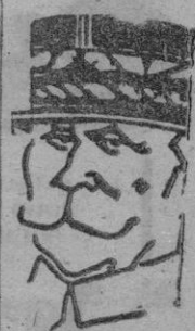
EL MARISCAL FELIPE PETAIN

«Los daños, afirma el Capitán General de la Región, revisten caracteres de catastrofe que deben ser remediados con urgencia y espíritu cristiano. Todos y cada uno de los sevillanos deben colaborar en la medida de sus fuerzas. Como Capitán General de la Región, y de acuerdo con el Alcalde, cuyo celo es digno de elogio, he iniciado una suscripción a la que esperamos contribuirán todos los sevillanos sin excepción.»