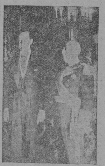
El Dr. Radio con S. E. el Jefe del Estado en el acto de la presentación de cartas credenciales como Embajador de la Argentina en España.

El Embajador argentino presenta sus cartas credenciales al Caudillo