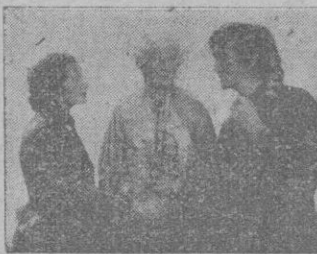
Una escena de la película

Antes que nada, escribamos aquí lo que el diccionario—ese maracillo, so auxiliar, fingidor de sapientísimo erudiciones—dice de la palabra del título: «Mexicano.—Pueblo indio de la América del Norte hoy extinto, que habitaba en la parte S.E. del Estado de Connecticut. Fenimore Cooper le hizo célebre en sus novelas».