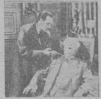
Una escena de la película

Clásica en el género de «ladrones y serenos» tiene el film las virtudes, y los pecados propios, aunque la trama acusa sino por entero una parte del poderoso ingenio de su creador Conrad Doyle. En este sentido la trama sin perder interés, llega hasta el punto culminante sin dejar as-