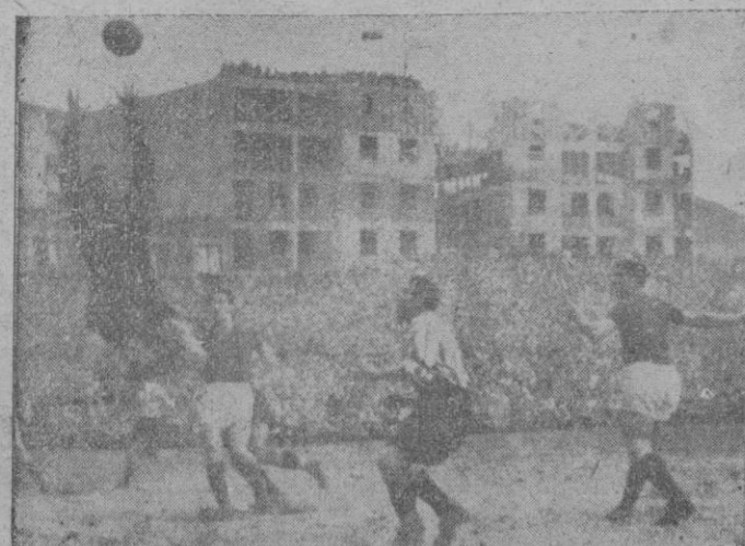
Bilbao. — En el Estadio de San Mamés, completamente abarrotado de público, se juega el partido entre el San Lorenzo de Almagro y el Atlético de Bilbao. El resultado fue de empate a tres tantos. — Blazina, meta argentino, salta para interceptar un centro de Iriondo a Panizo. — (Foto Cifra)