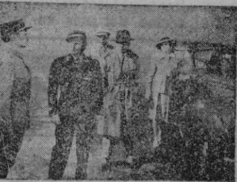
Una escena de la película