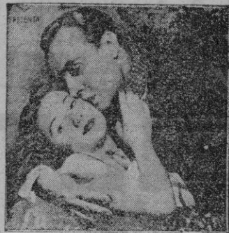
Joan Fontaine y Charles Boyer, intérpretes de "La ninfa constante".

BOEN HISPANIA y CAPITOL. Con el mismo título con el que se hizo popular la novela, nos llega ahora la versión cinematográfica de "La ninfa constante", excelente realización de Edmund Goulding. Todo el espíritu y la magnífica poesía de la narración inglesa está contenida en el film, rigurosamente fidedigno y, desde luego, interpretada de manera admirable.