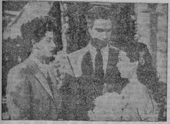
Una escena de «Como te quise te quiero»

"Como te quise te quiero" BORN, CAPITOL E HISPANIA