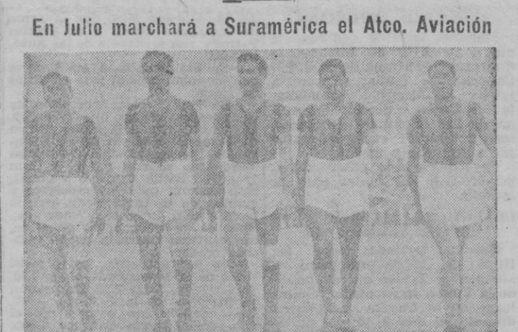
Esta es la línea delantera del San Lorenzo de Almagro, campeón de la Argentina, que vendrá a España.

Madrid. — El equipo de fútbol argentino San Lorenzo de Almagro llegará a España a mediados de este mes; El Atco, Aviación en el próximo mes de Julio marchará a Suramérica para actuar en encuentros amistosos a celebrar en Argentina, Chile, Uruguay y Brasil.