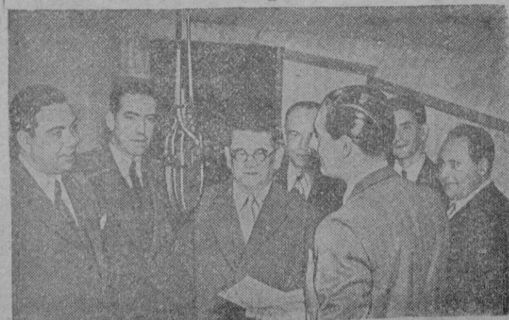
Un grupo de editores portugueses acaban de visitar Londres. Aquí los vemos fotografiados en la famosa estación londinense de la B.B.C. (British Broadcasting Corporation).