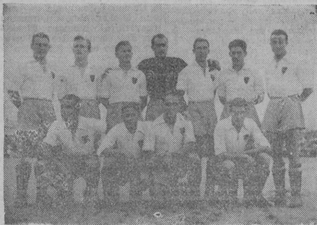
Uno de los últimos equipos del Real Zaragoza que nos visitaron