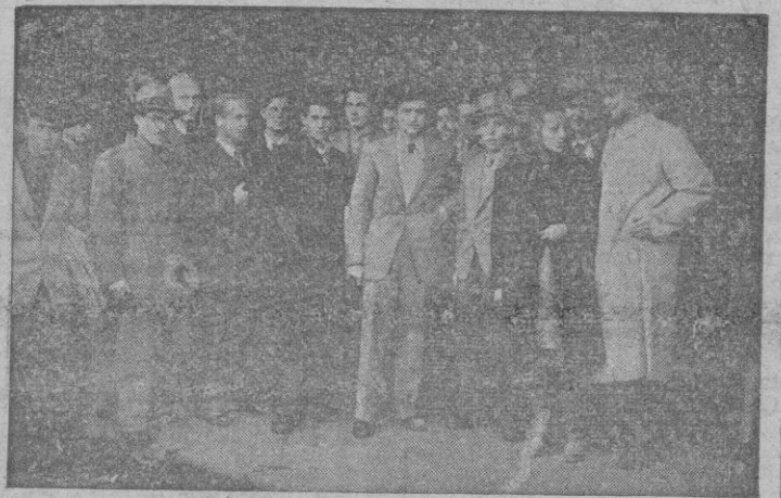
Un grupo de estudiantes polacos que proseguirán sus estudios bajo la protección de la Obra Católica de Asistencia Universitaria a su llegada a la capital de España.