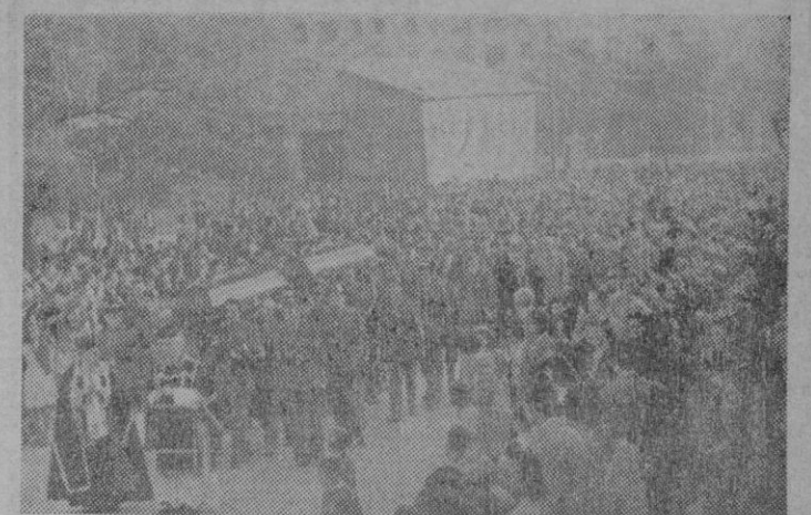
Un momento del entierro de los dos Guardias Civiles muertos en Madrid, en el cumplimiento del deber. Los féretros son llevados a hombros de los compañeros de las víctimas