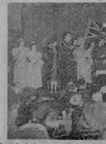
Después de la ceremonia de la boda de la hija de Lord Mountbatten, los Soberanos ingleses acompañados de las princesas, del padre de la desposada y otras personalidades, brindan por la felicidad del nuevo matrimonio