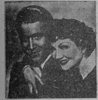
Claudette Colbert y James Stewart en el film «En este mundo traidor»

AVENIDA y LIBICO Pertenece este film de W. S. Van Dyke II, producción por la Metro, a la serie de los realizados sobre la guerra en la que él es un detective y ella una entrometida de las labores propias del sexo del galán. Con eso ustedes ya sabrán color a esta película en la fecha exacta de su realización y, también, en su género peculiar, del que fue pareja destacada Mirna Loy y William Powell. Aunque inspirado en una novela, el film se le ha dado aire de comedia de enredo, con muchas situaciones forzosamente cómicas y otras, muy rebuscadas, que caen dentro de la franca patochada. Verbigra las del detective vestido de boy-scouts, por no citar otras.