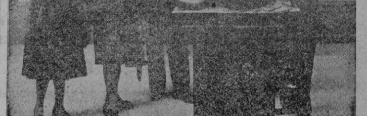
El Marqués de Lozoya, Director General de Bellas Artes y otras personalidades inauguran en el Palacio del Retiro la Exposición de obras presentadas al Concurso Nacional de Pintura, Escultura y Lavado.

35.000 mensajes de los Ex-Cautivos al Caudillo