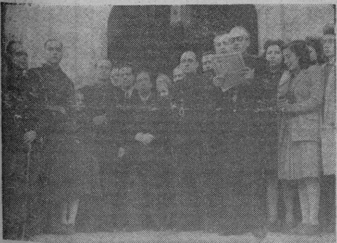
El Director General de Seguridad, el Delegado Nacional de Sindicatos, el Delegado Nacional de Ex-Cautivos, el representante del Alcalde y otras personalidades, a la salida del funeral celebrado el 29 del con motivo del Día de los Caídos