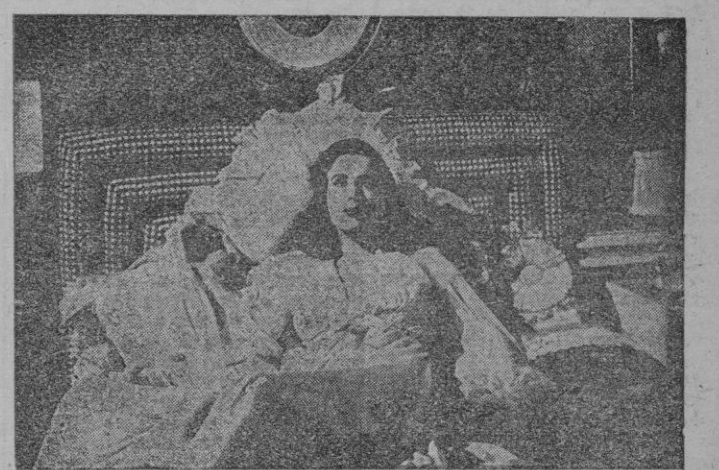
Diana Durbin en una escena de «Su primera noche», estrenada ayer.