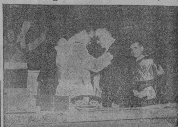
El Ministro de Educación Nacional acompañado de otros miembros del Gobierno y relevantes personalidades de la ciencia española, durante el solemne acto de la imposición del referido galardón al Profesor suizo señor Steiger.