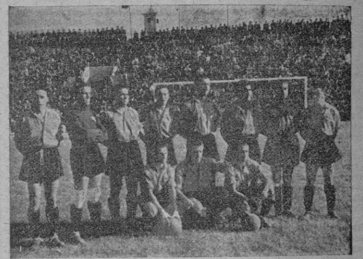
Cuando Juanet obtuvo la inevitable «foto» de la alineación, sobre el inmenso graderío de «Es Fortí» flotaba todavía un ambiente de interrogación o pesimismo...

El pelotón estaba ya en juego. Desde el saque, vimos nosotros que la cosa iba a rodar en forma muy distinta. Todos los jugadores se habían aprendido la lección. En el oído de cada cual debía de sonar con insistencia el latigazo de aquellas manifestaciones hechas con una afinidad impresionante por distintos rotativos peninsulares: «soy un despreciado de mi antiguo club», «soy un deshecho». Y naturalmente que la conciencia del buen deportista se rebelaba. Iban a por el balón como auténticas fieras indomables. Seguir a contrarrio hasta apurarles y desconcertarles. Jugaba el espíritu y se podía mucho más que todas las formas físicas escritas en los tratados de los más entendidos. El compañero de tribuna parecía impaciente no por ver el gol del Mallorca, sino por ver el fa-