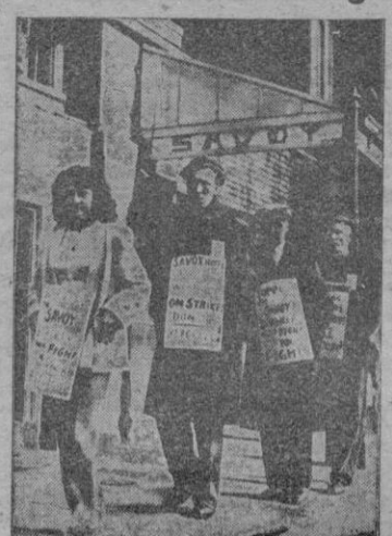
Los empleados del famoso hotel londinense «quique» la entrada del edificio con sendos carteles en sus peticiones.