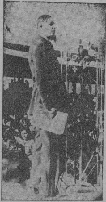
El general De Gaulle durante su importante discurso pronunciado recientemente en la ciudad de Epinal ante una gran multitud y en el que se declaró contrario a la nueva Constitución.