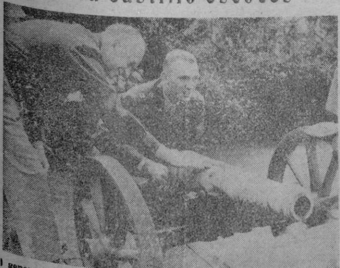
El general Eisenhower y su hijo el capitán John Eisenhower examinan un cañón viejo emplazado en los terrenos del Castillo de Culzean en el Condado de Ayrshire (Escocia), que le fué regalado por su destacada labor durante la guerra