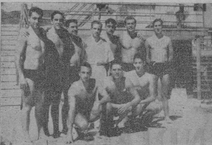
El equipo español que tan rotundo triunfo logró sobre el conjunto lusitano, en el reciente encuentro internacional disputado en Santa Cruz de Tenerife.

GABARDINAS A PLAZOS LAS ENCONTRARA EN QUILLET - Paseo Generalísimo, 50