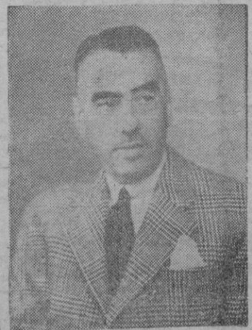
Don Ramón María de Pujadas nuevo Ministro de España en Colombia.