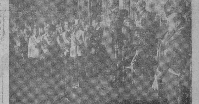
S. E. el Jefe del Estado contesta a las palabras del Alcalde de la ciudad en el Salón de Capitanía General en su reciente visita a Burgos el día 1.º de Octubre