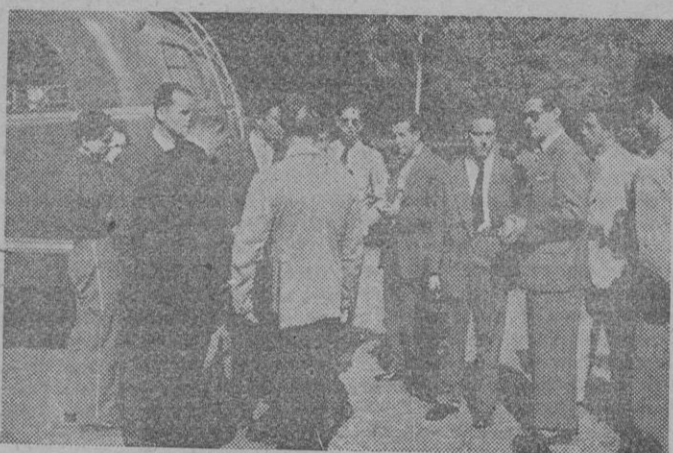
Los seleccionados portugueses de Natación a su llegada a Madrid procedente de Lisboa y camino de Santa Cruz de Tenerife, donde se celebra el encuentro de Natación entre España y Portugal