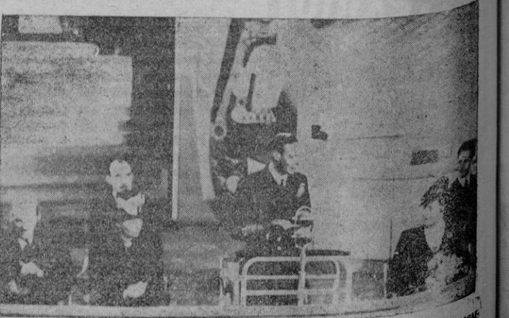
Londres.—El Rey Jorge durante su discurso en el acto de inauguración de la exposición de «Lo que Inglaterra puede hacer», que refleja la situación industrial de la Gran Bretaña.